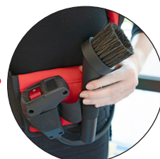
Heupriem voor accessoires

Het nieuwe slanke en ergonomische ontwerp biedt veel draagcomfort. Het harnas is ademend, verstelbaar, corrigeert de houding en heeft een heupriem waarin de meest gebruikte accessoires meegenomen kunnen worden. De geïntegreerde handbediening biedt de RSV150 optimaal gebruikscomfort.